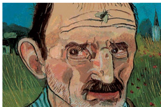
Dal SAN Carte da legare. Versione rinnovata del portale tematico del SAN